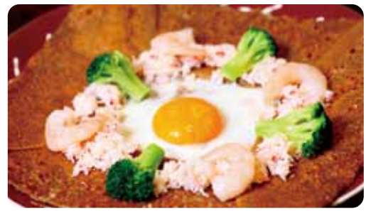
クリスタッセ "紅ズワイガニと真珠海老"