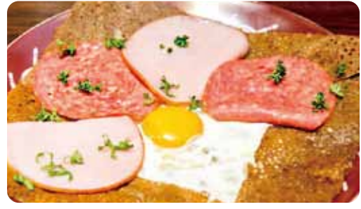
コンフレ "パンデメレ風 2種のハム仕立て"