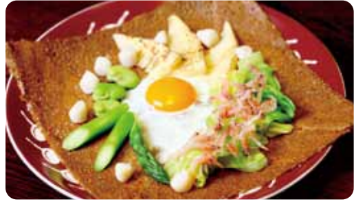
フランタン "桜海老とミニ帆立"