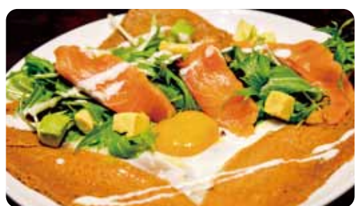
アトランティック "サーモンとアボカド"