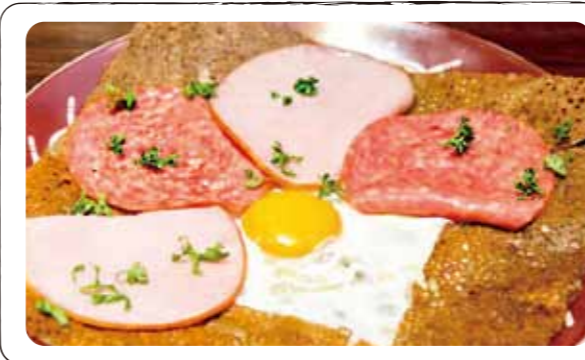
3 コンフレ "バンデメレ風 2種のハム仕立て" Complète (Galette with egg, cheese, ham) (卵、チーズ、ハム)