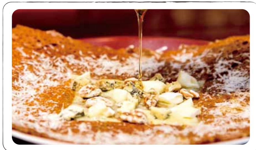
2 キャトル・フロマージュ "4種のチーズとハチミツ" Quatre fromages (Galette with 4 kind cheese, walnut, honey) (4種チーズ、ハチミツ、胡桃)