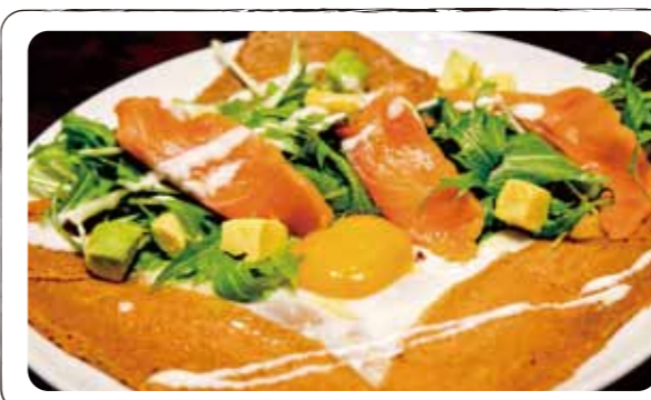
7 アトランティック "サーモンとアボカド" Atlantic (Galette with egg, cheese, salmon, avocado, potheb mustard, onion sauce) (卵、チーズ、自家製スモークサーモン、アボカド、水菜、玉ねぎソース)