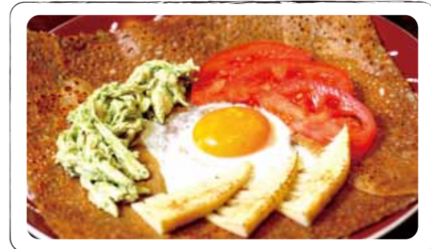
4 ジェノベーゼ "森林鶏のバジル和え" Genovese (Galette with egg, cheese, marinated basil chicken, bamboo shoot, tomato) (卵、チーズ、森林鶏胸肉のバジルソース和え、筍、トマト)