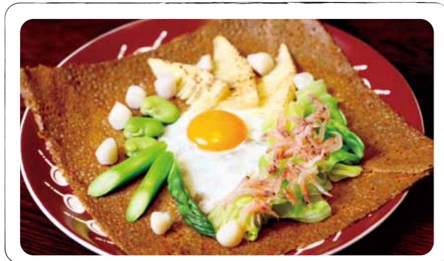
1 フランタン "桜海老とミニ帆立" Printemps (Galette with egg, cheese, sakura shrimp, scallop, bamboo shoot, Asparagus, broad bean, spring cabbage, aurora sauce) (卵、チーズ、桜海老、ミニ帆立、筍、アスパラ、空豆、春キャベツ、オーロラソース)