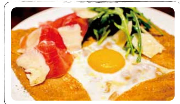
6 ジャンボンクリュ "フランスの生ハム" Jambon cru (Galette with egg, cheese, bayonne ham, salad, parmesigiano cheese) (卵、チーズ、仏バイヨンヌ産生ハム、サラダ、削りたてパルミジャーノ、EXバージンオイル)